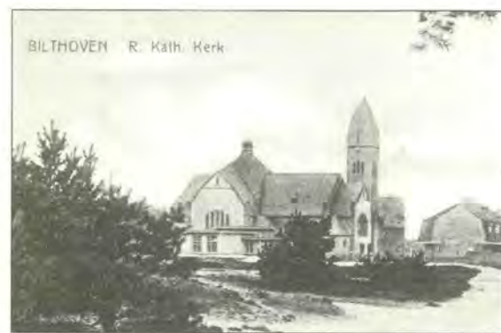
Zicht vanuit het oosten op de school, de kerk en het dubbele woonhuis Gregoriuslaan 15 en 17