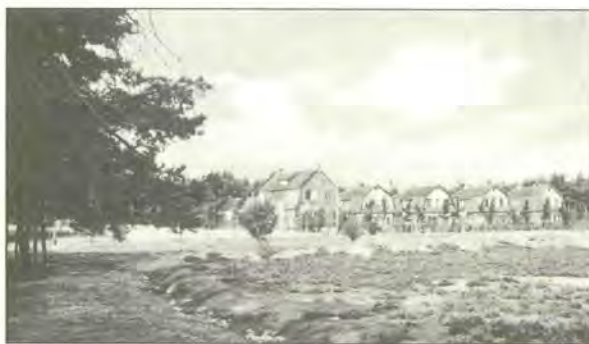
De meest linkse villa fungeerde vanaf 1923 als noodkerk voor de parochie van O.L. Vrouwe van Altijddurende Bijstand