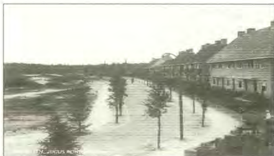
De Dr. Julius Röntgenlaan omstreeks 1934

In 1933 werd mijn oudste zusje geboren, in 1934 zag ik het levenslicht en in 1938 mijn jongste zusje. Bewust hebben wij de in die jaren gestarte bouwactiviteiten in de omgeving niet kunnen waarnemen. In mijn eigen vroegste herinnering zag de omgeving er als volgt uit: aan de Gregoriuslaan stond oostelijk van de school een blok met drie woningen, waarvan het meest oostelijke huis op de hoek naar de Dr. Julius Röntgenlaan stond. Die laan was, op een wat hoger gelegen huizenblok aan de linkerkant na, alleen aan de rechterkant bebouwd en liep dood tegen een stukje dennenbos. Op de hierbij afgedrukte foto, die waarschijnlijk dateert uit 1935, ziet u de eerste fase van deze laan.