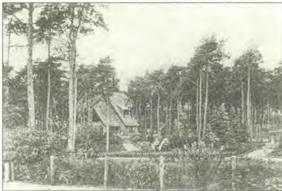
De Dennenhut, Beethovenlaan 7

Waarom deze villa de huisnaam De Dennenhut mee kreeg, ziet u op bijgaande oude foto, een riante ligging midden tussen de dennenbomen.