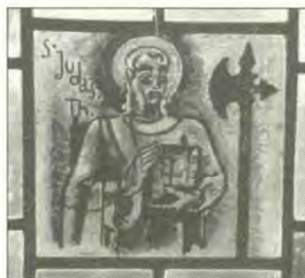
S. Judas Thaddeüs

(Iran). Voor zover bekend heeft hij geen bijbelboeken geschreven. Toch wordt hij afgebeeld met een boek, in de St. Jan te Den Bosch zelfs met een boekrol. Mogelijk is het een verwijzing naar zijn werk als verkondiger van het christendom.