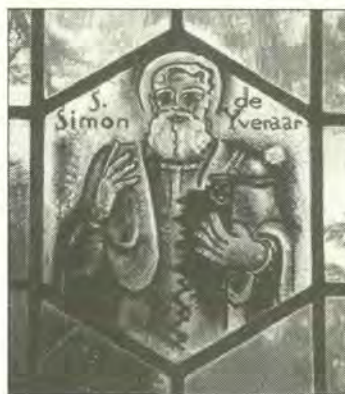
S. Simon de IJveraar

om het evangelie te verkondigen. Volgens de legende werd hij doormidden gezaagd (een andere vertelt dat hij stierf aan het kruis).