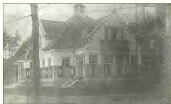
Trinari