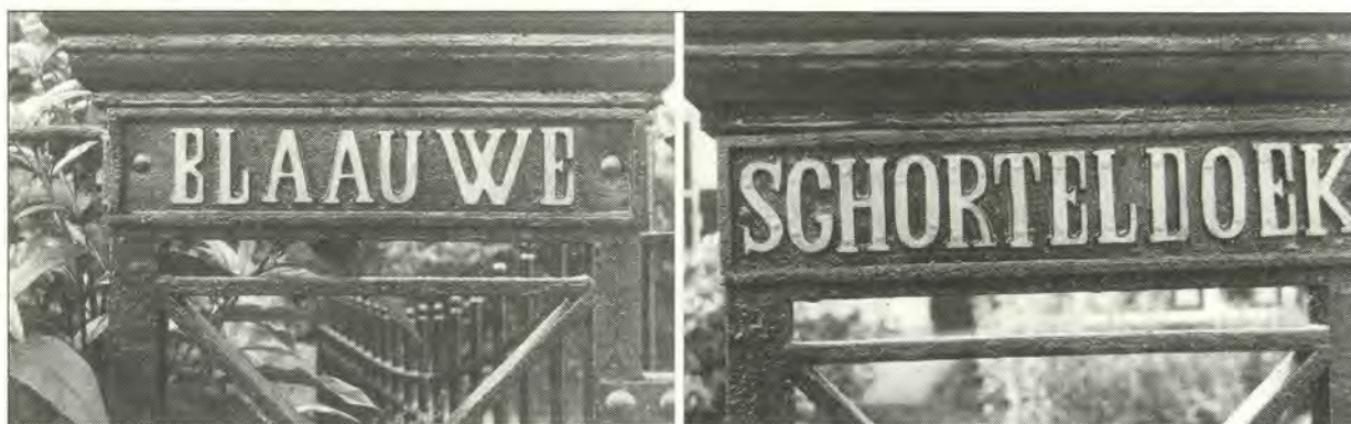
Tot ver in de twintigste eeuw stond de naam van de Blauwe Schorteldoek op de hoekpalen van het hek.

Wie vanuit De Bilt richting Zeist gaat over de N 237, zal zich bij het passeren van de Schorteldoeksesteeg mogelijk afvragen waar die bijzondere naam vandaan komt. Voorbij de huisnummers 21 en 19 ziet de passant dan een mooie witgeschilderde villa met nummer 17 en op het voorerf een ijzeren hek met op de linkse hoekpaal van de toegang de letters Blaa... Dit laatste nu is het restant van de benaming die vijftig jaar geleden nog op de twee hoekpalen te zien was: Blauwe Schorteldoek.