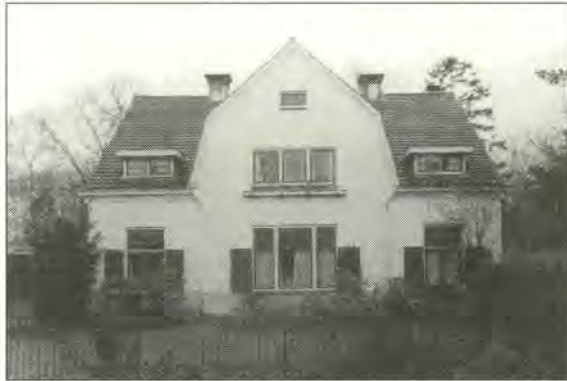
De Blaauwe Schorteldoek op een foto van 1977

Zeister Kroost een stuk grond gehuurd of gekocht dat tot de Biltse Blaauwe Schorteldoek behoorde of andersom. Wie wil verkennen, zal na het genoemde huisnummer 17 van de Blaauwe Schorteldoek ook de nummers 15 en 13 dienen te passeren en zelfs de Kroostweg-Noord moeten inslaan, want volgens een adresboek van De Bilt en Bilthoven uit 1971 en een latere uitgave woonden daar op de Kroostweg-Noord 177 ook een of meer Biltaren. Dat is nu ook nog zo.