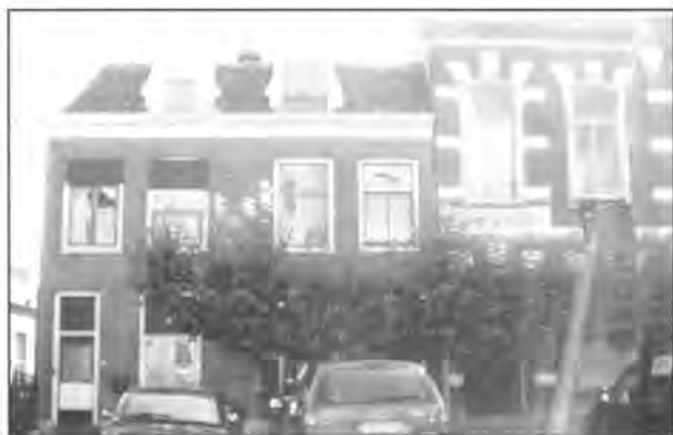
Dorpsstraat 21-23

Op vrijdag 15 mei is door het Archeologisch Adviesbureau RAAP een begin gemaakt met het archeologische onderzoek van de Dorpsstraat. Het onderzoek heeft zich toegeespitst op het terrein achter Dorpsstraat 21-23.