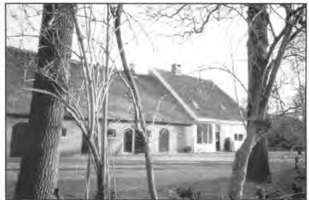
Boerderij de Voorst

Ten aanzien van het openen van de mogelijkheid tot vestiging van winkels in het onderhavige uitbreidingsplan verzoeken wij U hieromtrent contact op te nemen met het Contactorgaan voor de bouw van Middenstandsbedrijfspanen."