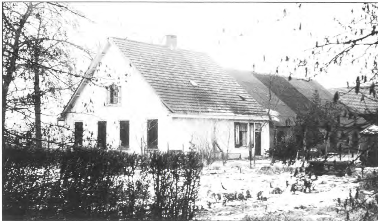
Boerderij De Voorst

boerderij die nog bestaat, met adres Rietveldlaan 62. In de kadastrale atlas van 1832 staan de bezittingen behorend bij De Voorst onder andere vermeld onder de kadastrale nummers D 20 tot en met 27a, zijnde in het bezit van de erven van Nicolaas Theodorus van Voorst. Nummer 25 wordt daarin als 'huis en erf' bestempeld.