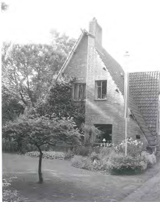
De Baronie, De Hoogblaas 9.