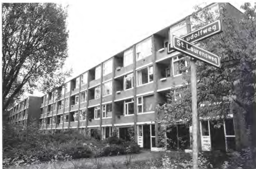
Flats aan de Abt Ludolfweg 1-107 in De Bilt met inpandige balkons of loggia's. (Foto Rob Herber 2007)

De leden van het Rozekruisersgenootschap sliepen in het begin tijdens de conferentieweekenden in tenten op het terrein of logeerden bij gezinnen in Lage Vuursche. Er werd een tempel gebouwd en het hoofdgebouw is successievelijk uitgebreid, vergroot en gemoderniseerd. Thans verblijven er tijdens een conferentie ongeveer 300 tot 400 gasten. Ook het omliggende terrein is in de loop der jaren door grondaankopen aanzienlijk vergroot en bedraagt nu 48 ha.