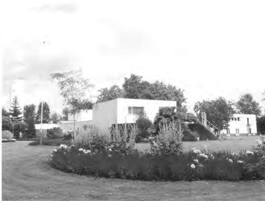
Renova vooraanzicht thans.

Op 24 juli 1936 verleent de gemeente De Bilt vergunning voor de bouw van een instituut tot opleiding in Architectuur en Decoratieve Kunsten op een drie ha groot terrein aan de Maartensdijkseweg. Het wordt een langgerekt gebouw in de vorm van de letter L, parallel aan de Maartensdijkseweg, ontworpen in