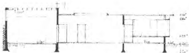
Gedeelte uit de tekening uit 1939 met het ontwerp van een benzine-station aan de Soestdijkseweg in Bilthoven.

vestigt zich later in Oosterbeek. Op uitnodiging van de beroemde Amerikaanse architect Frank Lloyd Wright vervult hij van 1947 tot 1950 een gasthoogleraarschap aan de universiteiten van Southern California en North California