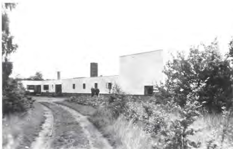
De hoofdingang van Elckerlyc met rechts het woongedeelte van Wijdeveld.