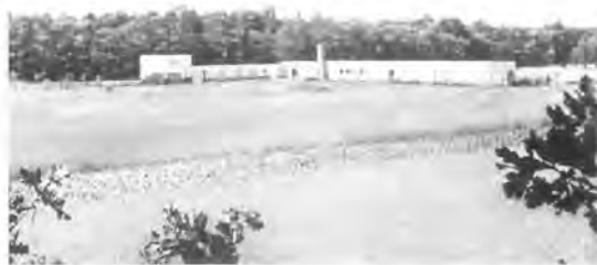
Elckerlyc in de jaren dertig.