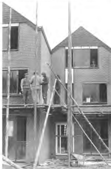
15 november 1975. Iepenlaan 57.

Uit de notulen van 29 april 1975 bleek dat het Bilthovens Bouwbedrijf De Jong B.V. zich had teruggetrokken uit de bouwcombinatie met Van Laar. Ook werd vermeld dat men een subsidieaanvraag had ingediend voor de eerste 58 premiekoopwoningen.