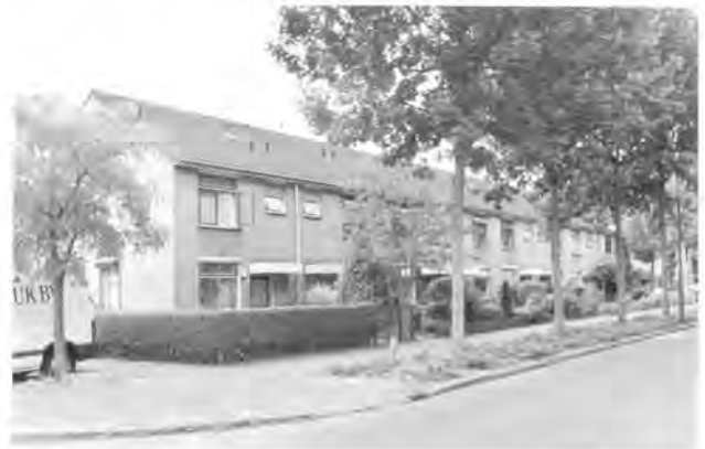
Berlagelaan Woningwetwoningen, 2006.

Uit het verslag van 22 november 1977 bleek dat het college van B. en W. akkoord ging met het door de werkgroep gedane voorstel om de bouw van de circa 100 premiekoopwoningen kort na elkaar te laten plaats vinden. Het gebied waarin het eerste gedeelte was gepland was eigendom van de gemeente en was pachtvrij. Het gebied waarop de overige 50 premiewoningen moesten komen moest nog pachtvrij gemaakt worden. Er was inmiddels contact geweest met de pachter die onder zekere voorwaarden bereid was aan een pachtontbinding mee te werken. Betreffende de vijfde fase (J.J.P. Oudkwartier) werd tijdens de vergadering door de voorzitter