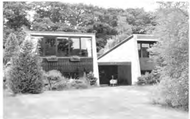
Berlagelaan Experimentele woningen, 2006 (foto Hans Haan).

over de realisering van de vierde fase, een plan betreffende 100 premiekoopwoningen (Bongerdlaan e.o.). Die woningen zouden komen te liggen ten noordoosten van de woningwetwoningen die tot de derde fase behoorden. In dat gebied lagen nog twee boerderijen, te weten de Voorst en Leyenoord. De pacht van laatstgenoemde boerderij zou ontbonden moeten worden. De werkgroep wenste een spoedige beslissing betreffende boerderij de Voorst. De meningen over al dan niet handhaving van de boerderij waren verdeeld. Er werd geopperd om, indien economisch en technisch uitvoerbaar, in de boerderij alleenstaanden te huisvesten. Ook zou er een groepspraktijk van huisartsen en tandartsen in kunnen worden ondergebracht. Uit het verslag van 30 augustus 1977 blijkt dat er al plannen waren betreffende de vijfde fase. Het betrof de bouw van woningen met meer woonlagen, geschikt voor alleenstaanden (J.J.P. Oudkwartier). Er was nog steeds geen besluit genomen betreffende de doortrekking van de randweg, in de plannen als T7 aangeduid. Men diende met de aanleg echter nog wel rekening te houden. In het verslag stond verder vermeld, dat er problemen waren gerezen betreffende de bouw van de 19 atelierwoningen. De heer Konter van woningbouwvereniging