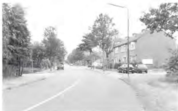
Berlagelaan Keuzewoningen, 2006.

bouwrijp maken begin oktober gereed moest zijn. Betreffende de vierde fase (plan de Voorst) deelde de voorzitter mee dat het college besloten had de bouw van de 100 premiekoopwoningen in twee gedeelten te doen plaatsvinden. Het college wilde voorlopig nog niet tot ontbinding van de pacht overgaan van de in het gebied gelegen boerderij Leyenoord. Wel was inmiddels door de raad besloten dat boerderij de Voorst gehandhaafd zou blijven. De heer Van Liefland vroeg zich af of het wenselijk was het plan betreffende de premiekoopwoningen te splitsen. Er waren volgens hem voldoende gegadigden voor de te bouwen woningen. Bij splitsing zou men tweemaal de hele procedure moeten doorlopen betreffende artikel 19 van de Wet