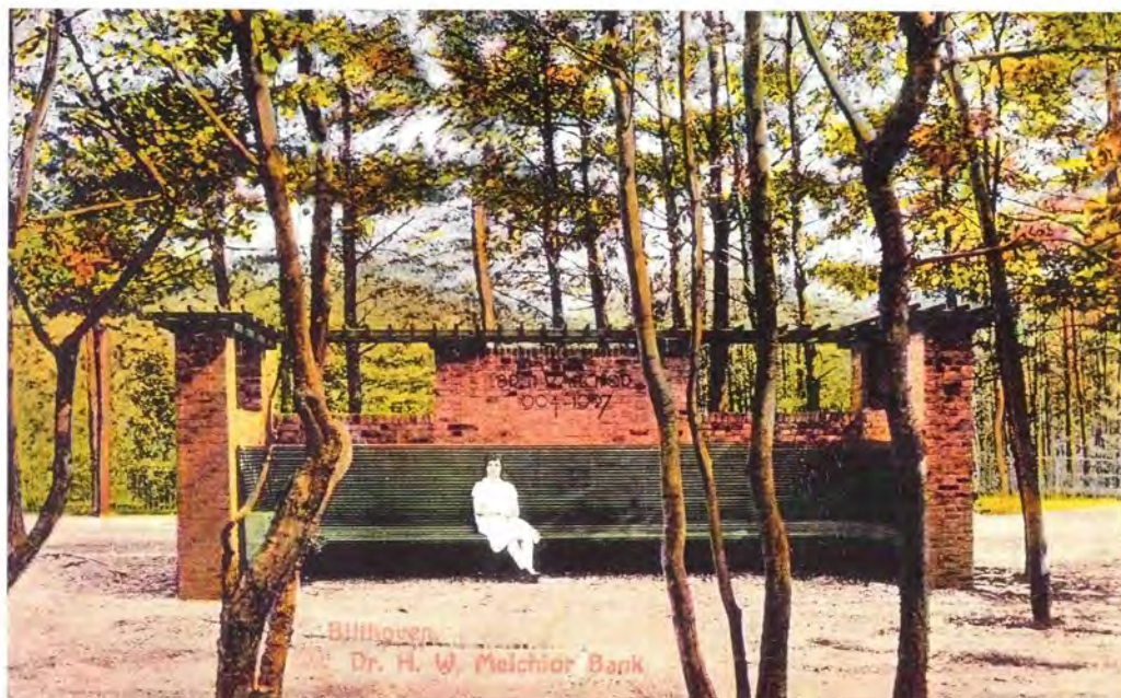
De Melchiorbank op het Vinkenplein in 1930, genoemd naar de Biltse arts die de naamgever van Bilthoven was.