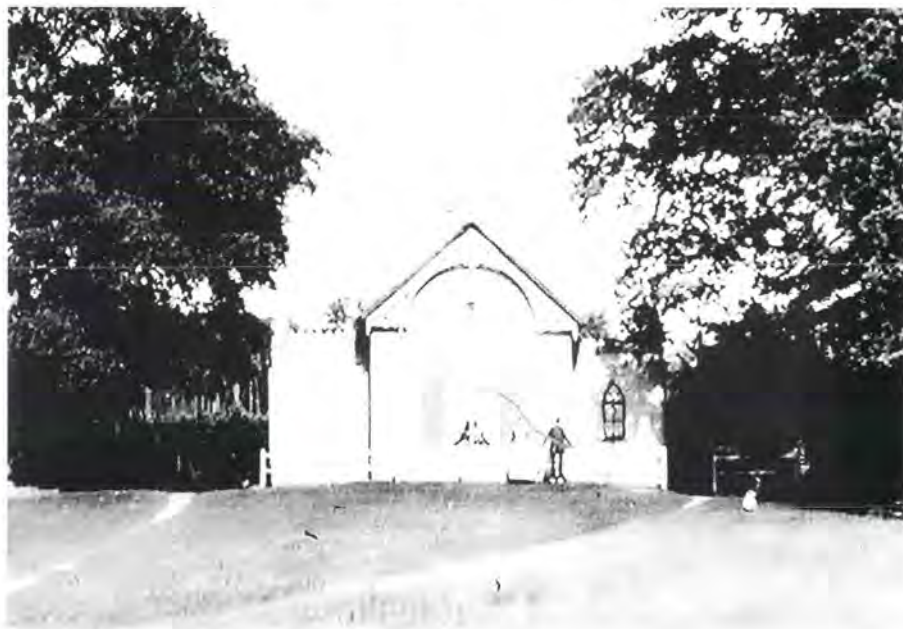
Het Klompje, in 1848 als boerderijtje verhuurd. De foto is waarschijnlijk in de dertiger jaren gemaakt.

De onbekende ontwerper van de nieuwe woningen op Vollenhoven sloot aan bij de