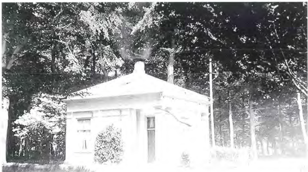
De portierswoning aan de Utrechtseweg, afgebroken in 1926.

De woning voor de portier is opgenomen in de eerste kadaster-beschrijving van De Bilt in 1832, met het nummer C 480bis, wat later