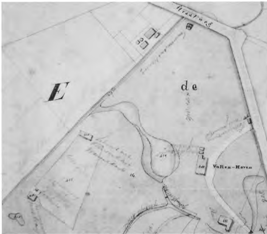
Uitsnede van de kaart uit 1848 met aantekeningen van Kluppel. Bovenaan, onder het woord “straatweg”, het huis van de timmerman, met schuin daaronder, ondersteboven: “Timmermanswoning”. De portierswoning ligt aan het eind van het bovenste deel van de ronde oprijlaan. Hierbij staat, eveneens ondersteboven: “portierswoning met schuurtje”.

achterzijde van deze kaart is de timmermanswoning in 1842 gebouwd. 5 Voor zover bekend was het op het landgoed de eerste dienstwoning met deze functie. 6