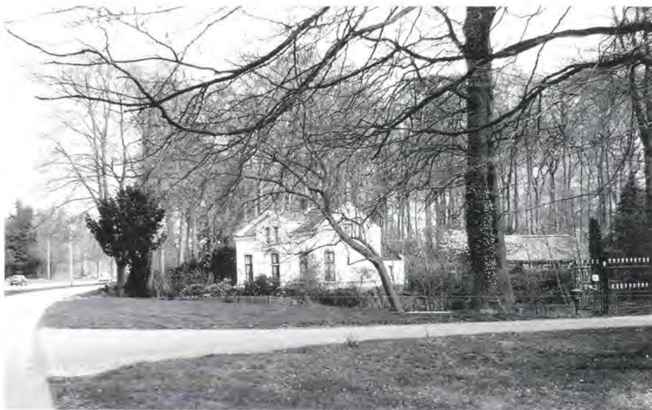
De voormalige timmermanswoning aan de Utrechtseweg. Erachter stond in de negentiende eeuw een timmerloods, die later plaats heeft gemaakt voor een schuur.

als portiershuizen in gebruik waren; voor zover bekend waren er in die tijd geen portiers meer op Vollenhoven.