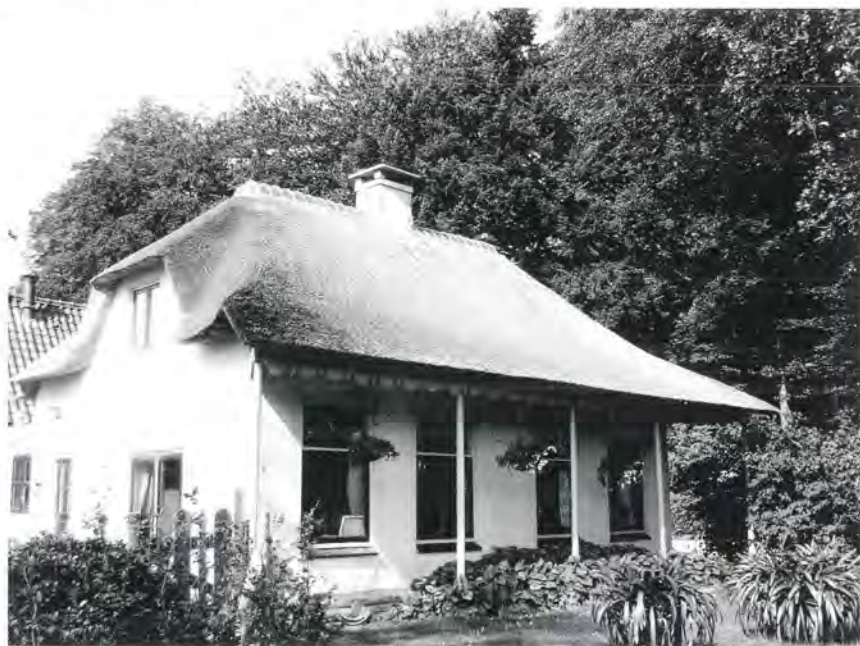
Utrechtseweg 41, gebouwd in 1832, bevatte vroeger twee daglonerswoningen, elk met twee ramen aan de voorzijde. Erachter stond een bakhuis. Tegenwoordig is dit één woning, waar het bakhuis bij is getrokken.

de rand van het park ( Utrechtseweg 41 ), dat volgens aantekening in het kadaster in 1832 is gebouwd. 17 Dit huis wordt wel omschreven als 'de voormalige tuinmanswoning'. 18 In werkelijkheid bevatte het huis oorspronkelijk twee arbeiderswoningen, die in het kadaster de nummers C 540 en C 541 kregen. Volgens de veilingcatalogus van 1848 werd voor elke