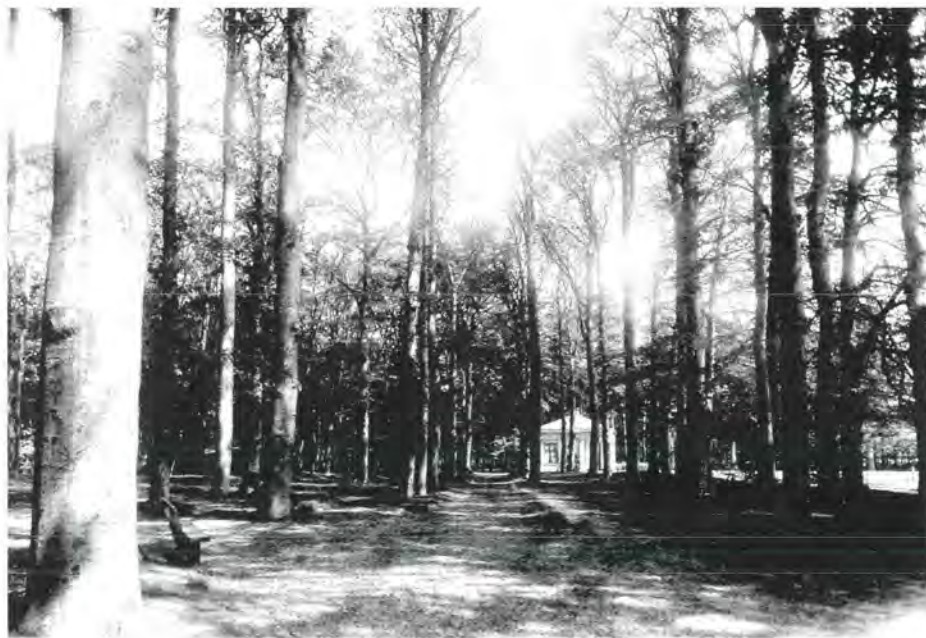
De portierswoning, gezien vanuit het park. Rechts de oprijlaan met aan de rechterzijde het hek om de voorweide, op de achtergrond de Utrechtseweg.

bekend dat Van der Capellen verschillende dienstwoningen op Vollenhoven liet bouwen. Een portierswoning past zeker in dat beleid; het huisje zou dan tussen 1827 en 1832 zijn gebouwd. Het huisje heeft er zo'n honderd jaar gestaan, tot het moest wijken voor de nieuwe, brede Utrechtseweg en gereduceerd werd tot een simpele notitie in het kadaster: „afbraak 1926”. 2