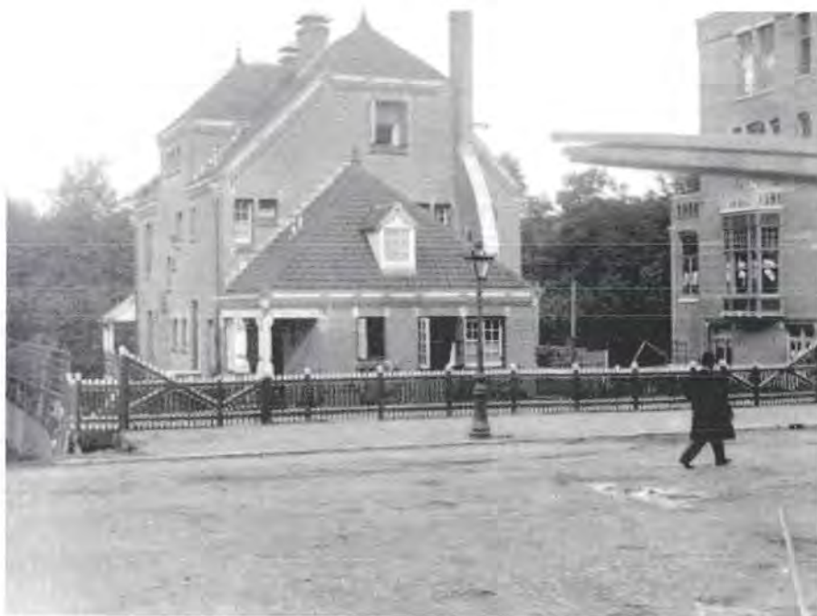
Parkwijk, Amsterdam, ca. 1902.

J.H. Cuypers ( Roermond * 16.05.1827 – Roermond