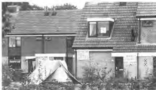
Protesten van bewoners tegen het gemeentelijk woonbeleid in de Leyen.

In fase 7 werden 149 woningwetwoningen gebouwd, waaronder vier aangepaste woningen en zeven bovenwoningen, die halverwege 1983 werden opgeleverd. De woningen werden verdeeld over de diverse woningbouwverenigingen. De wegen in fase 7 kregen de volgende namen: Bosrank, Bosroos, Bosanemoon, Bosbes, Bostulp, Egelantier, Eikvaren, Varen, Brem, Liguster, Hazelaar, Andoorn, Dravik, Herik, Klaver, Eikenlaan en