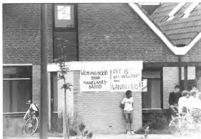
Protesten van bewoners tegen het gemeentelijk woonbeleid in de Leyen.

Kersenlaan, Perziklaan en Waltnootlaan) werden in de raadsvergadering van 25 november 1980 vastgesteld. Rond deze woningen ontstonden problemen. Niet alle woningen konden worden verkocht en werden na veelvuldige besprekingen in 1981 verhuurd. Waarschijnlijk was het kettingbeding de oorzaak. De kopers kregen bedingen opgelegd, die beperkingen meebrachten bij verkoop. De prijs voor het kleine type woning (36 stuks) bedroeg eind 1980 f 165.500, -. De grotere woningen (71 stuks) zouden f 170.500, - gaan kosten. Aanvankelijk waren er 411 gegadigden. Toch werden er in eerste instantie maar 50 woningen