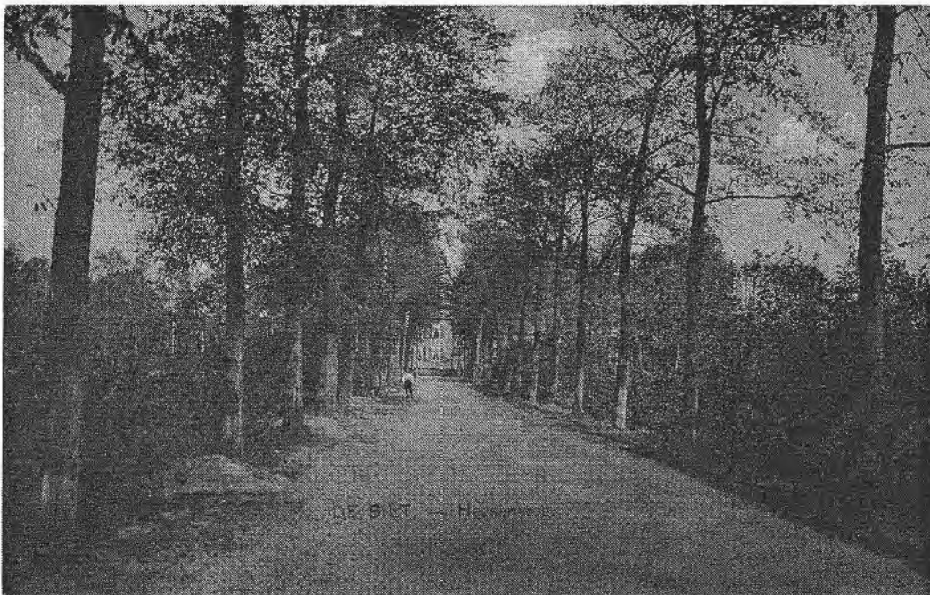
De rust op de Hessenweg in 1910.

de weg op de grens van de Achterdijk en de Blauwcapelse weg tot de onder u (=Groenekansche weg) genoemde weg: Hessenweg.