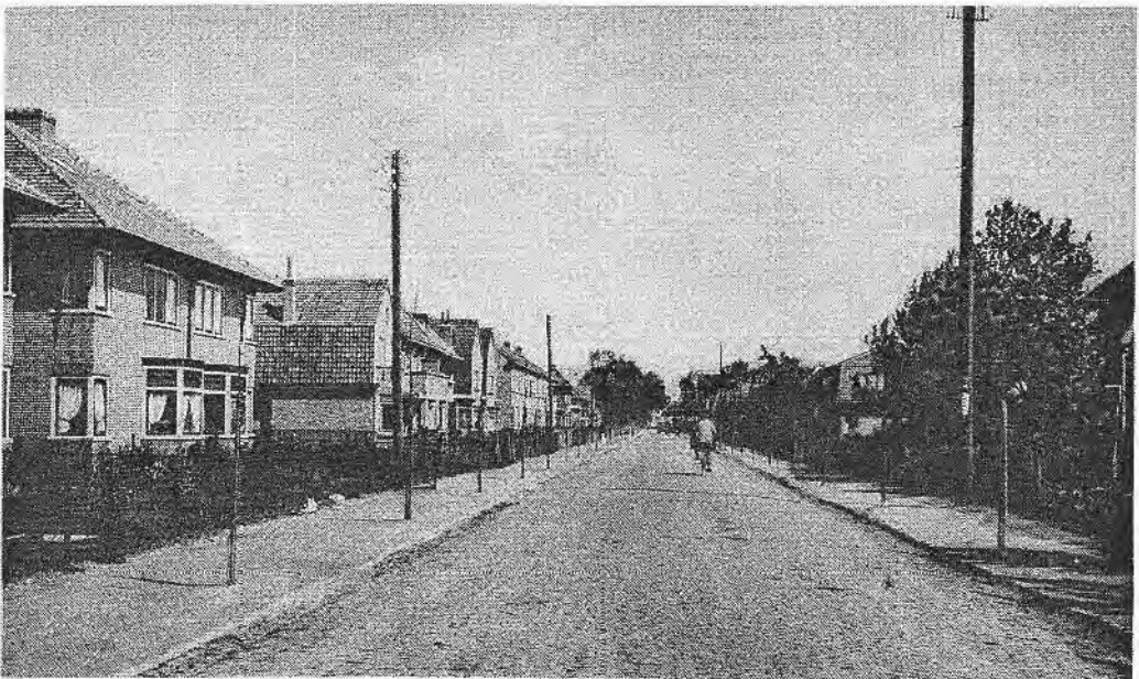
De Hessenweg in 1928. Op 17 januari werden de bomen geplant door de schooljeugd. De bomen bleven er staan tot 1960. (Zie ook De Biltse Grift nummer 2)