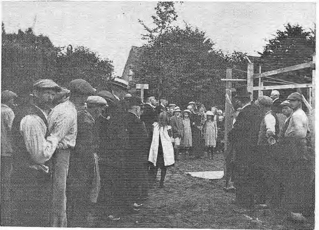
Op 26 juni 1919 werd de 1 st steen gelegd door Woningbouwvereniging Patrimonium voor de woningen aan de Hessenweg 49