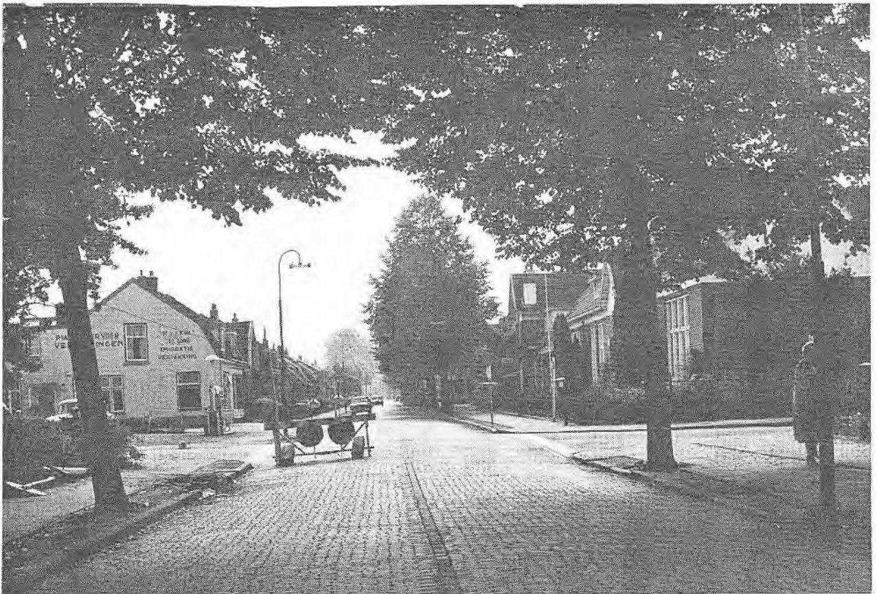
Het kruispunt van de Hessenweg en de Looydijk in 1960. Let op de School met den Bijbel rechts.