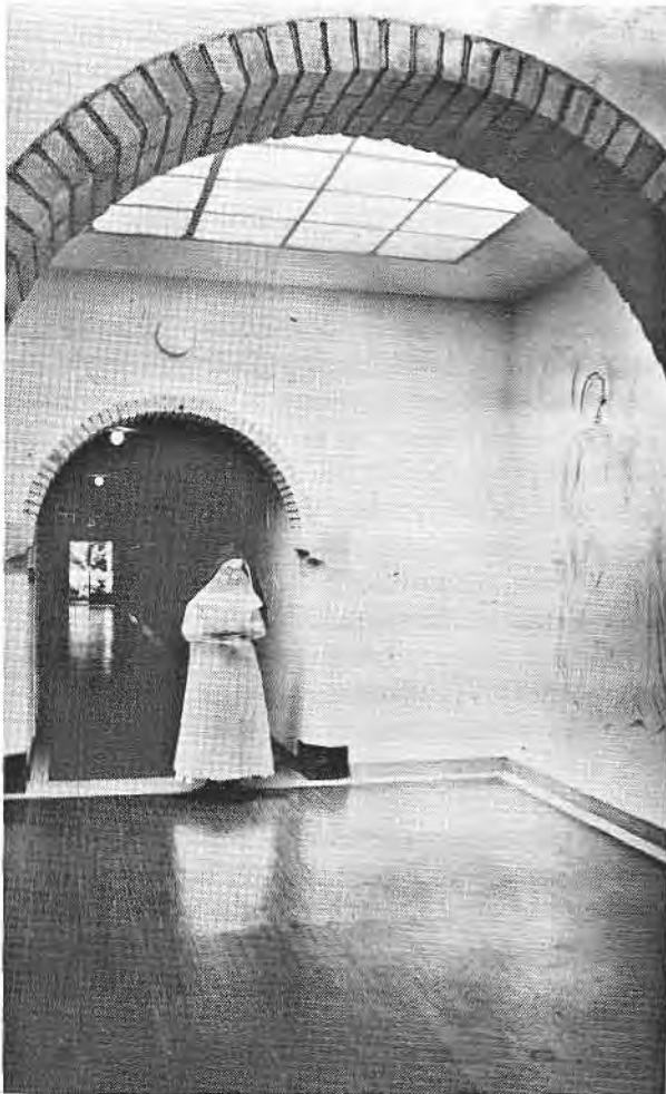
Één der zusters dominicanessen in de hal van het Mariapaviljoen ca. 1943.