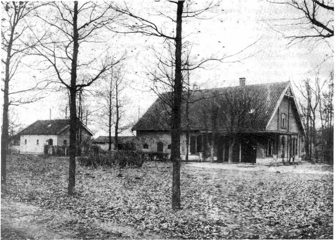
Boerderij De Varenkamp omstreeks 1900

Toen hij in 1904 overleed, sloten zijn erven een nieuw tweejarig huurcontract met de pachter. In de belastinglijsten komt Van de Haar dan echter niet meer voor, waarschijnlijk omdat zijn inkomen dan inmiddels onder de f 500,- is gezakt (het minimuminkomen waarover ingezetenen belasting verschuldigd waren).