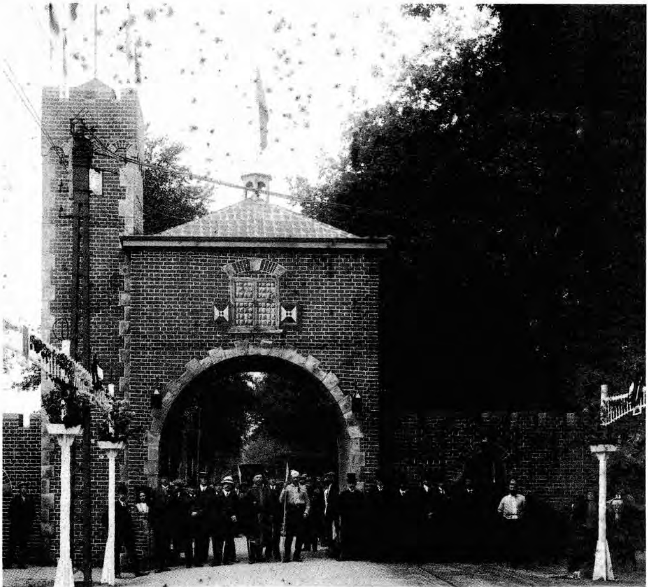
"100 JAAR ONAFHANKELIJK" 28 augustus 1913