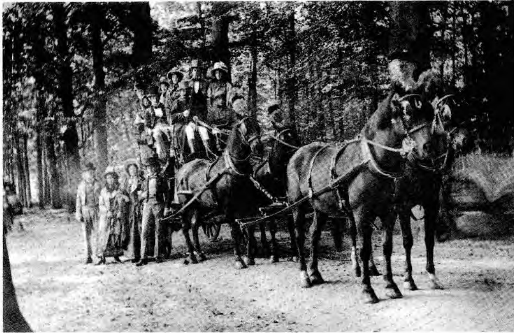
De bewoners zelf hadden vaak hun stoelen naar buiten gebracht en 'zaten voor hun eenvoudige woning te genieten van hun arbeid; luisterend naar vader's harmonica (...)'

Intussen zaten de beide grote hotels vol, zowel binnen als buiten. In de benedenzaal werd gedanst op de muziek van een zigeunerkapel. Er waren walsen, polka's, polonaises en ook de nieuwerwetse one-step werd ten gehore gebracht. Kortom het was feest... totdat de bezoekers naar huis wilden vertrekken. Toen bleek dat Centraal Spoor geen extra trams had ingezet. Was het 's middags al een bijna onmogelijke opgave gebleken om vanuit Utrecht in De Bilt te komen (in een coupé van 24 personen zaten er 48 of meer, men zat op elkaars schoot, er werd gevochten om plaatsen en de wet van de sterkste met de grootste mond gold), nu liepen de trams 's avonds maar eenmaal per half uur met de helft van de wagons van overdag. Om 23 uur kwam er zelfs helemaal geen tram meer! De krant schrijft: