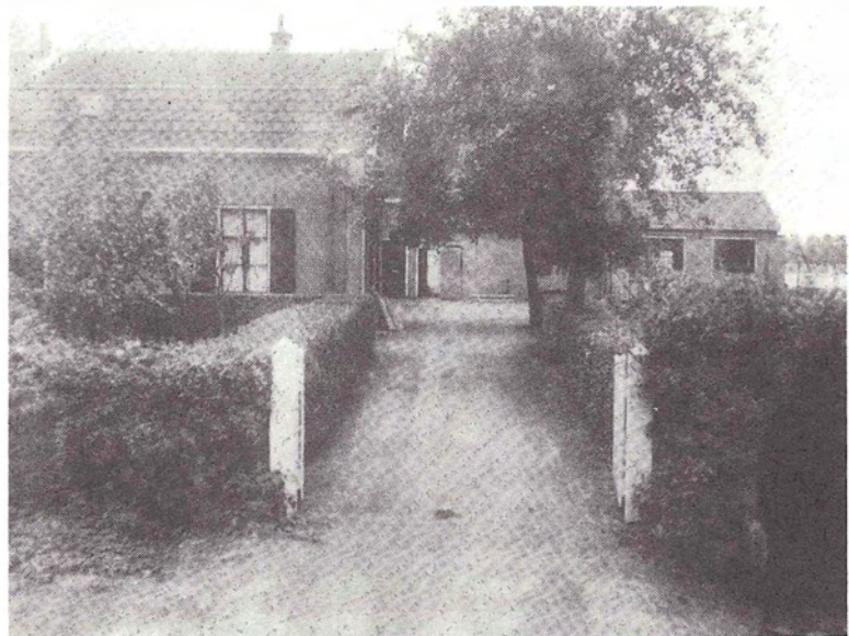
De hygienische Wasscherij, gezien vanuit het westen (1932 - 1934)