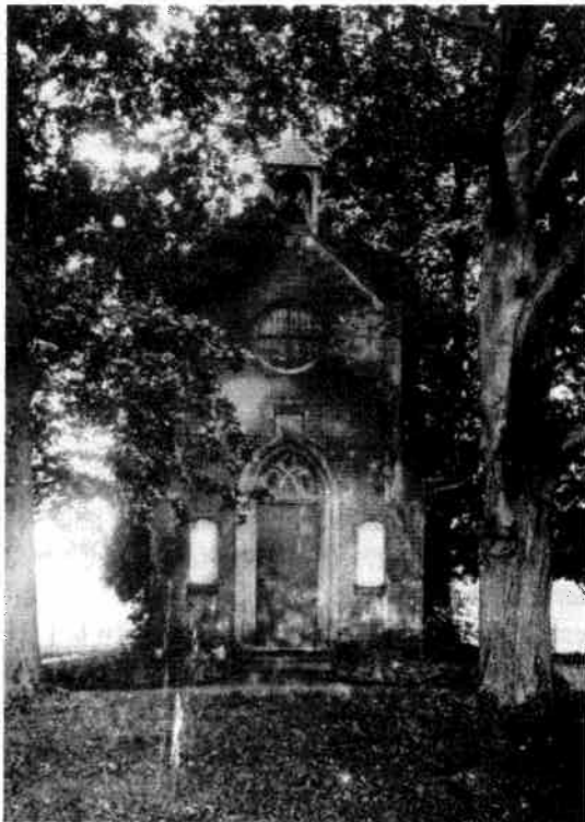
De folly zoals deze er in de jaren zestig uitzag

De folly verkeerde al jaren in ruïneuze staat. Er moest iets gebeuren, maar wat. De eigenaar, de Stichting Het Utrechts Landschap, en de architect, de heer ir. C.M. Beenen, hebben verschillende mogelijkheden in overweging genomen. Zo is de mogelijkheid besproken om de ruïne verder te laten vervallen tot er niets meer van over zou zijn. Deze optie is verworpen omdat het gebouwtje hiervoor te bijzonder is. Een tweede mogelijkheid was om de huidige staat van het gebouw te consolideren zodat verder verval voorkomen kon worden. Consolideren dus van de huidige ruïneuze kapel door deze wind- en waterdicht te maken of door bijvoorbeeld een tentconstructie over de ruïne te maken. Deze laatste mogelijkheid werd als te storend ervaren. Een derde mogelijkheid is om de folly te slopen en opnieuw weer op te bouwen. Deze optie werd als te kostbaar van de hand gewezen. Een laatste mogelijkheid is om de folly te restaureren. De vraag is echter hoe. Welke bouwfase neem je daarbij als uitgangspunt.