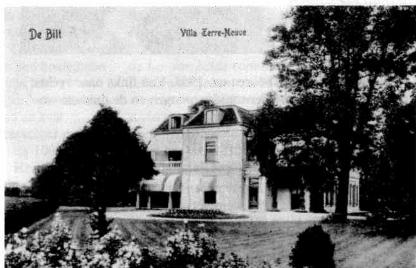
Villa Terre Neuve 1907. Uiterst links nog bouwland waarop in 1926 de Bilthovenseweg werd aangelegd.