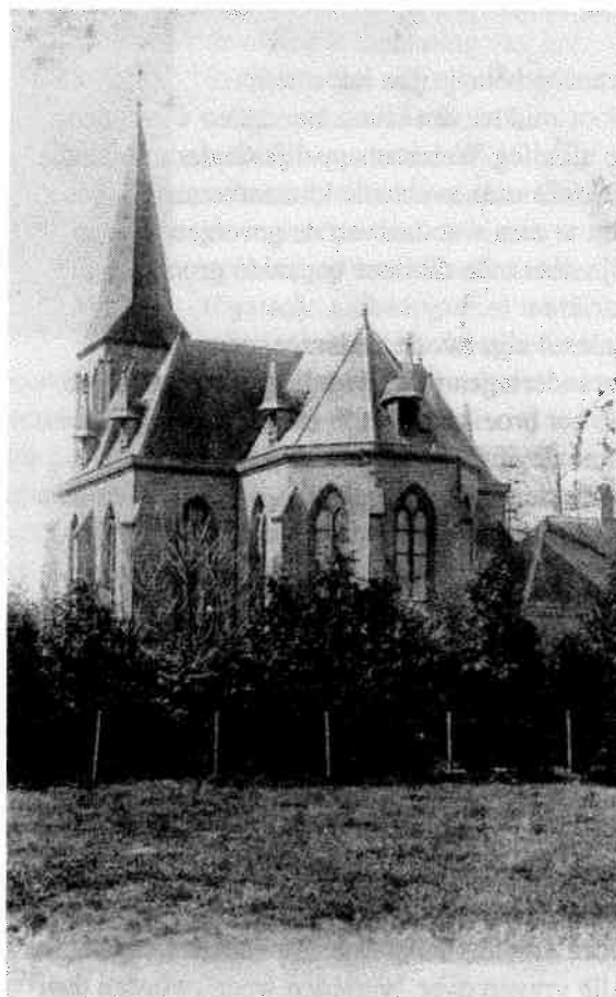
R.-K. St.-Michaëlkerk aan de Kerklaan te De Bilt omstreeks 1902.