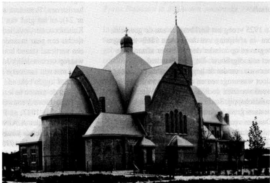
R.-K. Onze Lieve Vrouwe-kerk aan de Gregoriuslaan te Bilthoven omstreeks 1926.

Dit kerkhof is een begraafplaats van r.-k. signatuur, gelegen achter de kerk van de parochie Onze-Lieve-Vrouw van Altijddurende Bijstand aan de Gregoriuslaan 10 te Bilthoven. In 1921 kocht het aartsbisdom Utrecht vijf ha grond voor f 49.000,-. Bilthoven groeide snel en men verwachtte een evenredig grote groei van het aantal rooms-katholieken in het dorp.