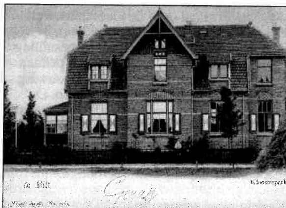
Dubbele villa op de Wilhelminalaan 48 en 50 in het Kloosterpark.

In 1899 vraagt W. Klinghardt uit Zeist bouwvergunningen aan voor de dubbele villa's op Wilhelminalaan 1/3 en 48/50, naar ontwerp van Joh. Meerdink. Klinghardt is ook de aanvrager voor de bouw van de eerdergenoemde dubbele villa Aprica en Kathinka, eveneens ontworpen door Joh. Meerdink. In 1902 voltooit Th.M. Loran, timmerman-aannemer uit Utrecht, de bouw van de villa Wilhelmina op huisnummer 6. Het burgerwoonhuis, dat op