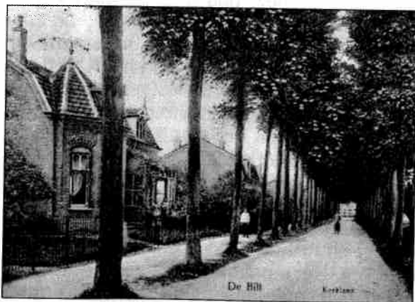
De Kerklaan omstreeks 1910. Het huis links is nummer 75.

We laten nu de Dorpsstraat achter ons en verplaatsen ons naar de Kerklaan. Deze laan dankt haar naam aan de in 1893 door bouwmeester A. Tepe gebouwde St. Michaëlkerk.