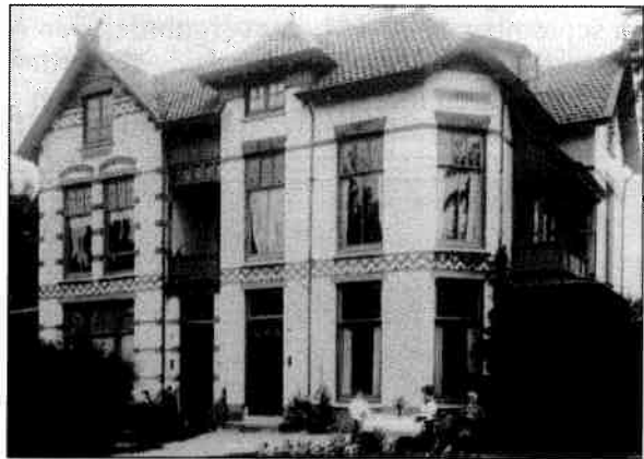
De villa's Appia en Bandoeng op de Soestdijkseweg 266 en 268.

Aan de overzijde van de Soestdijksche Straatweg verrees in 1900/1901 een aantal dubbele villa's, gebouwd naar ontwerp van J.H. Welsenaar uit Haarlem. Opnieuw was de aanvrager L.H. Westerhout. De opdrachtgever voor de bouw was de N.V. Villapark Station De Bilt. Het gaat hier om de villa's met de huisnummers 262 t/m 280. De gevels werden ooit getooid met respectievelijk de namen Zonnelust, Dennenoord, Appia, Bandoeng, Venbergen, Heidezicht, onbekend, Leijenstein, Boschlust en Rustoord. Al deze villa's staan er heden ten dage nog, zij het deels niet meer met het oorspronkelijke uiterlijk. Met uitzondering van Rustoord en Bandoeng zijn de huisnamen verdwenen.