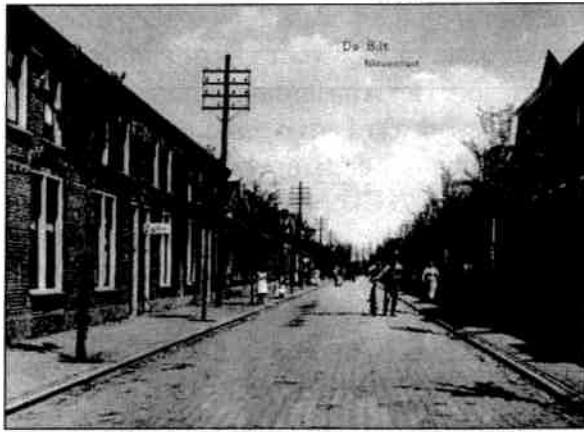
Nieuwstraat gezien in richting Looydijk in 1914, links de elektriciteitspalen met bovenleiding. Als je de draden volgt kom je vanzelf bij de centrale. Tussen de eerste twee palen verlicht een lamp ook deze straat.

ning, accumulatorenen- en machinekamer, ketelgebouw en kolenloods.