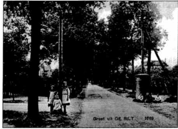
De 3½ meter brede Soestdijkseweg met naar links de Spoorlaan in 1910. Drie jongetjes zitten bij een trafohuisje van het type 'peperbus'. De lamp aan de paal boven de trafo is slecht zichtbaar.

Het zou jaren duren voor de gehele gemeente op het net was aangesloten. Dit blijkt ook uit een verzoek dat betrokkenen in 1909 aan de gemeente deden om straatverlichting aan te brengen op de Prins Hendriklaan, Leyenseweg en Soestdijkschen Straatweg. Een gebied dat toch nauw aansluit op de straten die het eerst zijn aangesloten, drie jaar eerder. Hoe belang-